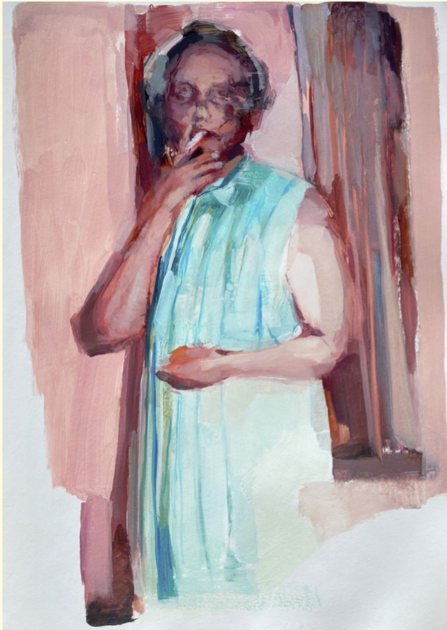
Abuela con mandarina